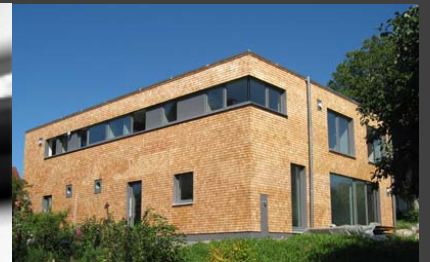
Svedo, Amtzell, Baujahr 2007, Schindelfassade Typ: Svedo LINIE_P