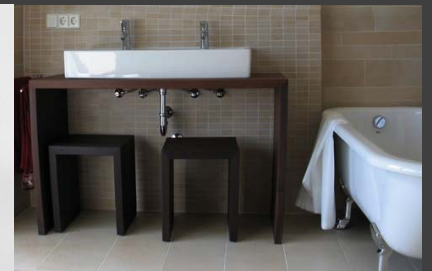
Svedo, Unterhomburg, Baujahr 2006, Innenansicht Badgestaltung, Typ: Svedo LiNiE_P